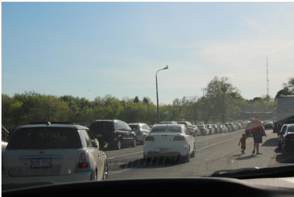
Voitures garées illégalement sur la voie d'accès à la maison Smith, entre les stationnements 117 et 118

La capacité d'accueil des stationnements lors des fins de semaine de beau temps est largement dépassée. La circulation sur la voie Camillien-Houde en est fortement affectée, entraînant une perturbation de la desserte en transport en commun ainsi qu'un risque élevé d'accidents entre les voitures, les cyclistes et les piétons.