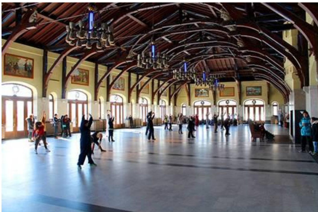
Appropriation de l'espace public – Occupation de la salle des pas perdus du Chalet du Mont-Royal tous les dimanches matins pour un cours de tai-chi avec musique amplifiée nuisant à l'usage normal des lieux.