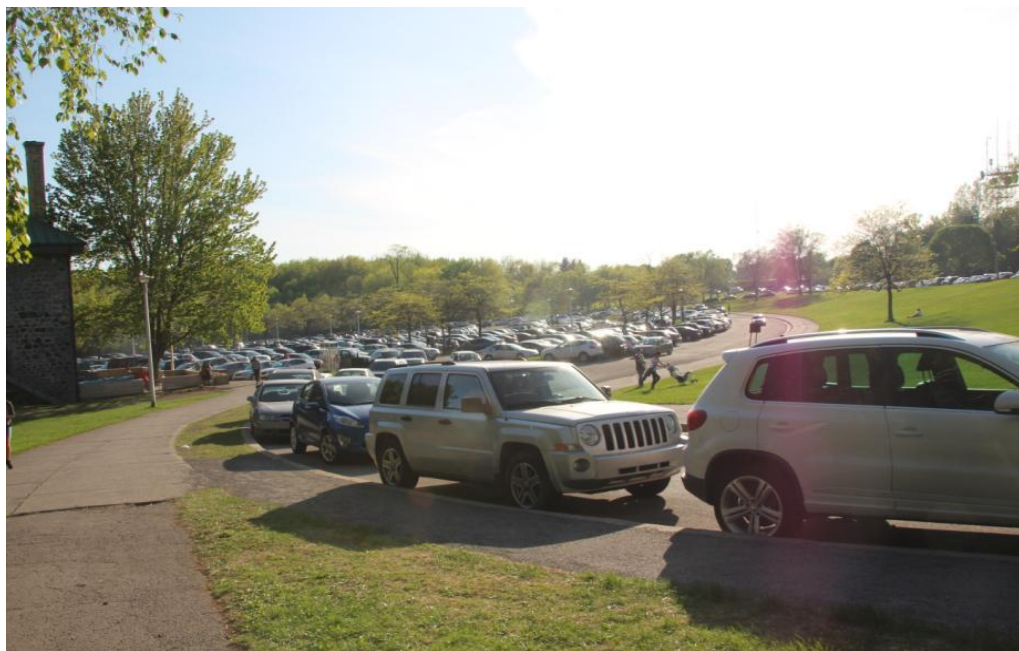
Voitures garées illégalement sur la voie de la bretelle de sortie du stationnement 117