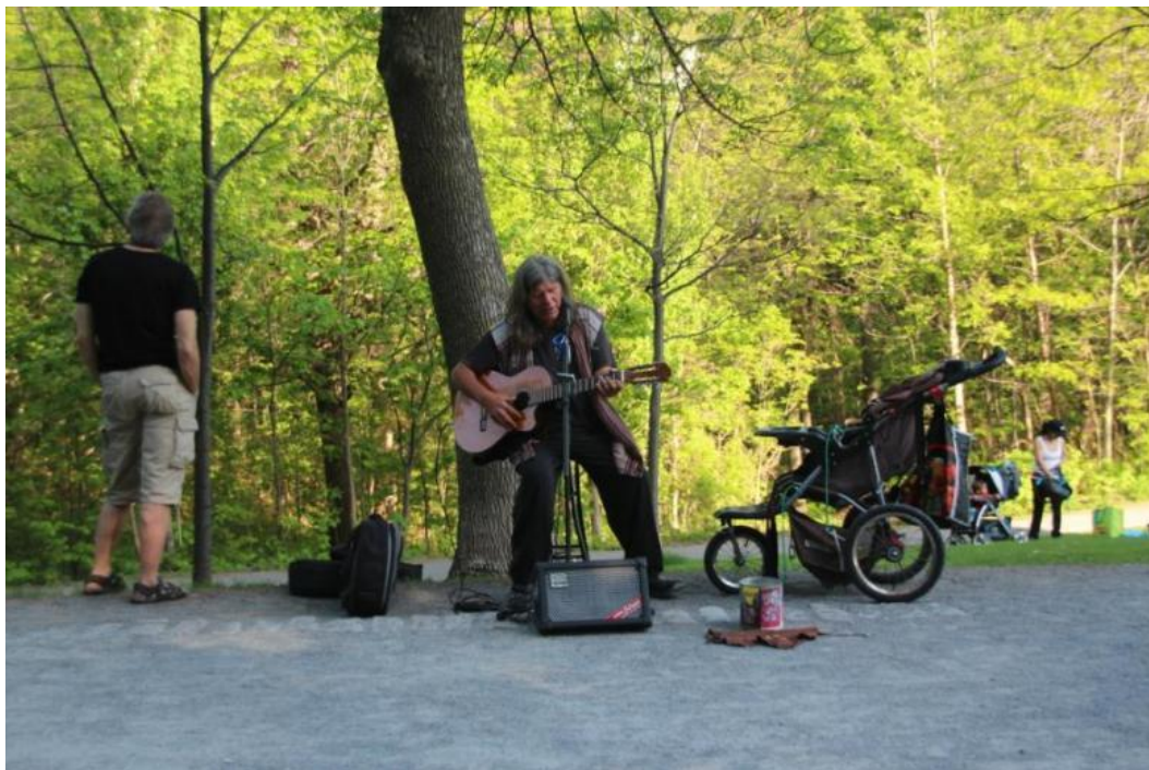
Musique amplifiée et sollicitation – musicien présent depuis plusieurs années toutes les fins de semaine sur le belvédère ou le chemin Olmsted. Problèmes d'amplification sonore et de sollicitation entraînant des plaintes récurrentes d'usagers.